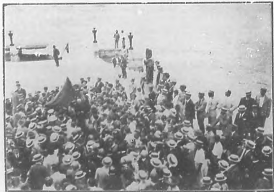
Un aspecto de la numerosa concurrencia que acudió a recibir a los Obispos de la Habana y Matanzas, en los momentos en que éstos desembarcaban por la Capitanía del Puerto.

Ya entrada la noche terminó esta agradable fiesta, que dejó un recuerdo imborrable en todos los concurrentes, por la gentileza,