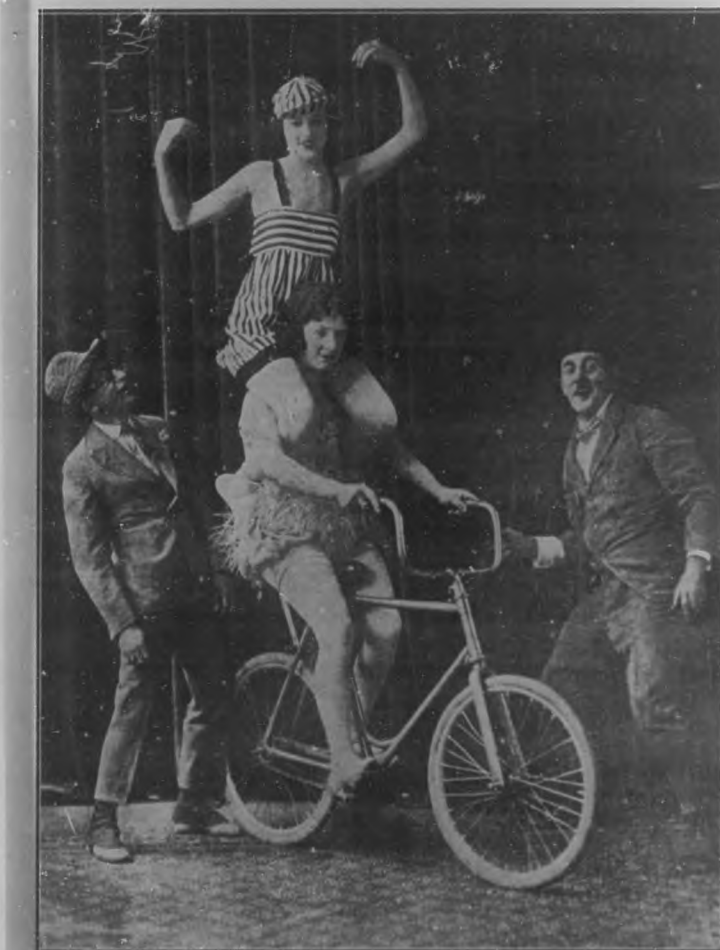
Notable troupe de ciclista "The Lykes" que debutará en "Payret" en la temporada elegante del circo "Santos y Artigas".

SE VENDE UNA COSEDORA Y UNA PLEGADORA EN BUENAS CONDICIONES. Para informes: Diríjase a la revista BOHEMIA, Trocadero 89.