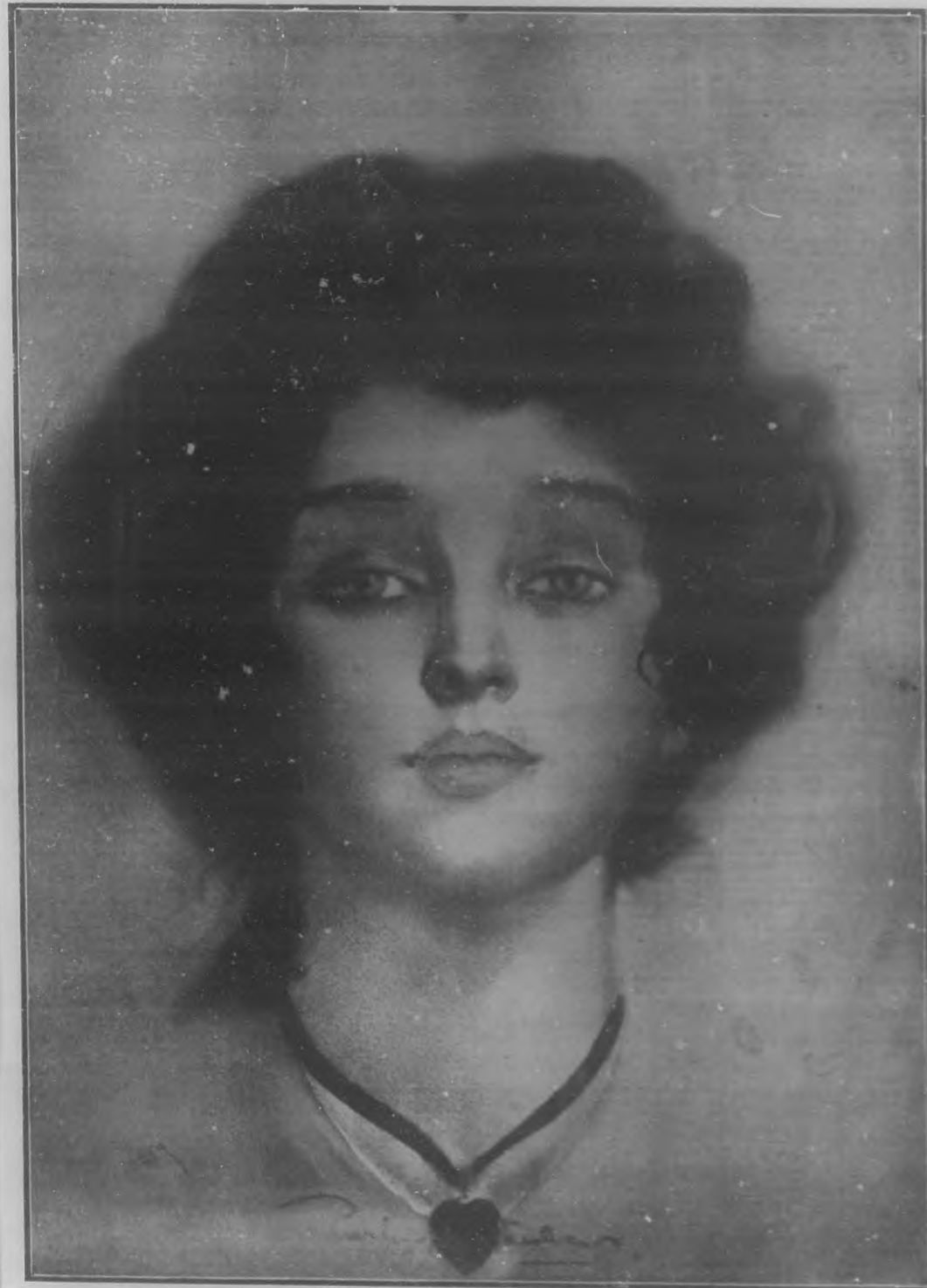
AMERICAN GIRL De la Exposición de Arte Español que se efectúa en la joyería Alvarez, Cobos y C.

¡Ah! vírgenes que os consumís tras las pálidas vitrinas que un sol amarillento apenas pasa y que con obsesión loca de ideal suspiráis por un prometido sin que llegue, ah, mancebos que languidecéis flácidamente en los portales de las tiendas y que habéis perdido el optimismo de los triunfadores; ¡Venid a mí! ¡Tomad del líquido de la vida! y yo os prometo por Astarté, la reina fatal del amor y de la muerte, que venturoso sol de gloria irradiará las sombras de vuestro desencanto!